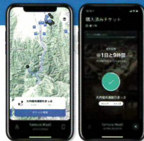
会津 samurai Maas