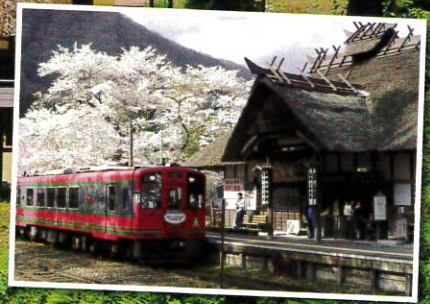
湯野上温泉駅とAIZUマウントエクスプレス