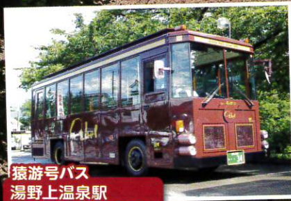
猿游号バス 湯野上温泉駅 ～大内宿間運行 ※画像はイメージです