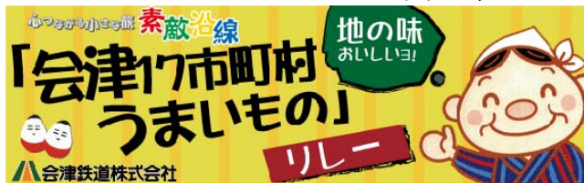
【駅前にあるおふくろの味】