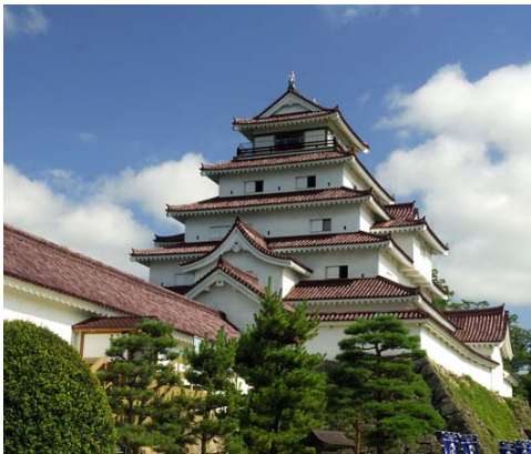
鶴ヶ城の画像はイメージです

幕末の面影を再現した赤瓦の鶴ヶ城天守閣が、3月27日ついとその雄姿を現します。リニューアルオープン記念として、3月27日から31日までの5日間は鶴ヶ城天守閣の入場が無料に！また4月1日からは、天守閣有料入場先着2万名様に、葵の紋をあしらったオリジナル会津塗箸がプレゼントされます。