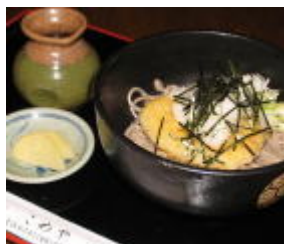
おろし揚げ餅そば