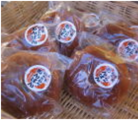
並べたそばから売れてゆく