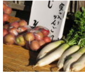
新鮮！採れたて野菜