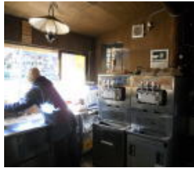
ランプがいい雰囲気