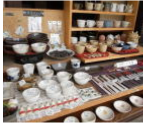
ほっとする陶器たち