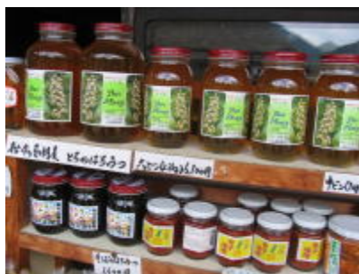
松本屋純粋はちみつ各種