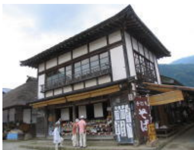
軒先にたくさんの商品が並び