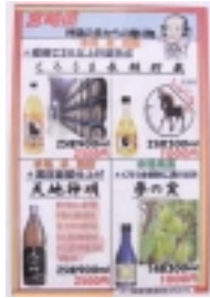
種類豊富なお酒のメニュー

[情報はこちら！] http://www.13.plala.or.jp/akahige/