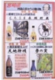
種類豊富なお酒のメニュー

[情報はこちら！] http://www.13.plala.or.jp/akahige/