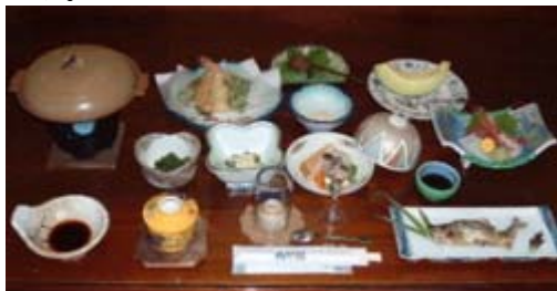
その時期一番のおいしい素材を使った料理