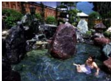
大きな岩で造られた露天風呂

[情報はこちら！] http://www.minsyuku-yamagataya.com/