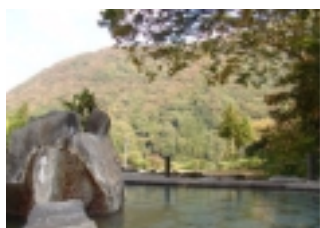
広くゆったりした露天風呂

[情報はこちら！] http://www10.ocn.ne.jp/~sisen/