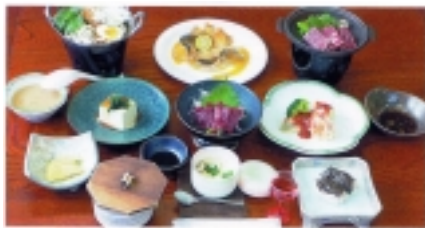
地元の恵みをいかした手作り料理

当館自慢のお風呂はすべて天然温泉の源泉かけ流しで24時間お楽しみ頂けます。男湯、女湯が1つずつ、露天風呂も男女1つずつあり、広くて気持ちが良いと大変喜ばれています。また、館内各所には主人の作品を展示させていただいており、お客様からは、ちょっとした美術館の雰囲気を楽しめる、とのお言葉を頂戴することも。もうじき紅葉の美しい季節がまいります。皆様もぜひ当館で、おいしい料理と気持ち良いお風呂をお楽しみいただけますよう、心からお待ちいたしております。