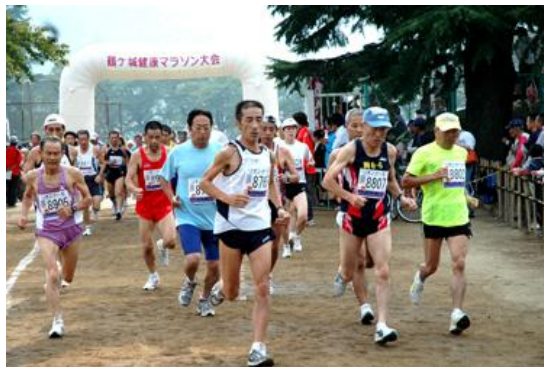
声援に送られ会津陸上競技場をスタート