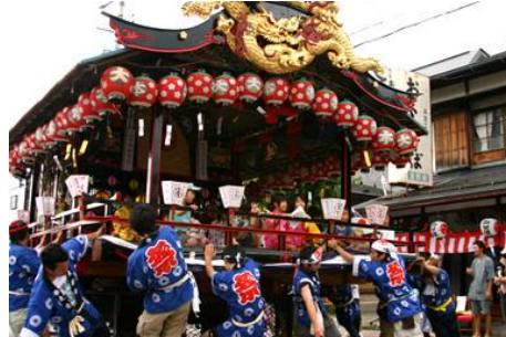
花嫁姿も艶やかな「七行器行列」 子供歌舞伎の舞台になる大屋台が町なかを運行

南会津町田島地区に伝わる「会津田島祇園祭」は、800年ほど昔にこの地方を治めた長沼氏が信仰する牛頭天王・須佐之男命を祭ったことが始まりとされています。22日の宵祭では、くり出される大屋台の上で「子供歌舞伎」が上演され、23日の本祭には花嫁姿の女性たちが神前へのお供物を捧げ待ち献上する「七行器(ななほかい)行列」や「神輿渡御」など、厳粛な雰囲気ながらも華やかな神事が行われます。また、最終日には神社の神楽殿で「太々御神楽」が奉納されます。奥会津田島地区に伝わる伝統の歴史と文化をぜひご覧下さい。