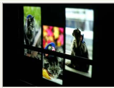
トンネル壁面に映し出された映像 です。