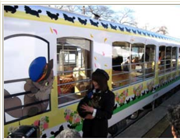
トンネルシアターが設置されている トロッコ車両。