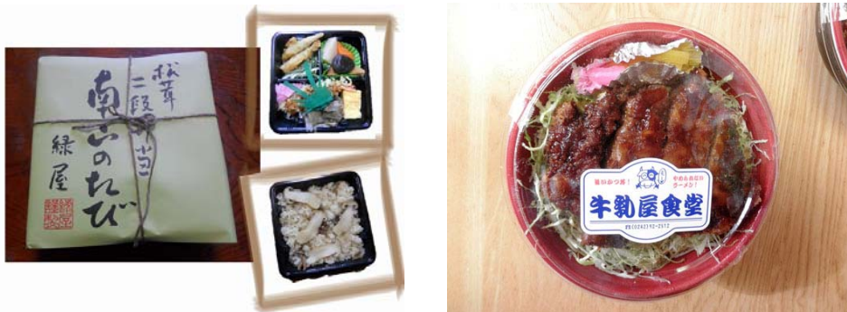
松茸二段弁当 「南山のたび」 1,000 円（税込）（写真左） 牛乳屋食堂の「ソースカツ丼弁当」 1,050 円（税込）（写真右）