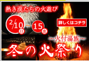
湯野上温泉火祭り