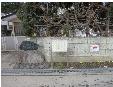
案内看板には当時の住宅地図が表示されている（写真左） 家の前にひっそりと建つ記念碑と案内板（写真右）

次はドラマ内でも登場していた会津藩校日新館です。現在は会津若松市河東町の小高い山の上に当時の姿そのままに再現されています。館内では当時の藩校の様子などを知ることが出来る展示がされています。