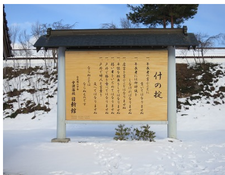
日新館の正門（写真左） 会津藩の教え「什の掟」（写真右）